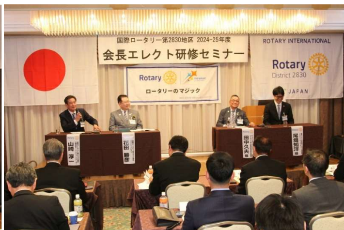
▲パネルディスカッション

初日の研修後の懇親会では、座席をグループごとに会長エレクト、次期幹事別に配置し、同グループのガバナー補佐やパストガバナーに同席いただきました。グループ内でのクラブ間の交流を深め、気軽に情報交換やメイキャップしあうような関係を築くことができればと思います。会場の一角には